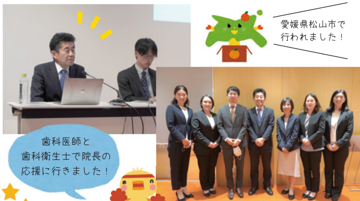
愛媛県松山市で行われました！