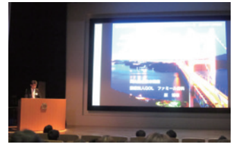
▲ 学会発表 / 院長

学会の認定資格は、学会参加による継続的な勉強と、厳しい認定試験をクリアしなければなりません。この認定試験を受験することが本人にとって大変なのですが、学びが多く、とても勉強になります。実際に、認定資格取得前と後では、患者さんに対する気持ちや目線がガラッと変わります。更に資格更新が必要なため、一度取得すると生涯研修が必要となります。「認定資格」を取ることは、本人が仕事を辞める時に、自分の行ってきた「仕事が形に遺る」とても大切なことだと考えています。