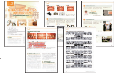
▲ 雑誌「ザ・クインテッセンス」へ掲載 / 院長

その他、学会発表や学会論文、講演、歯科雑誌への投稿などで、自分が行ってきた仕事を形にして遺しておくことは、自分自身のレベルアップに繋がり、後で自分の人生を振り返った時に、よく頑張ったなと自分を褒めてあげることができ、充実した人生にも繋がります。