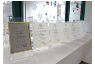
▲ 待合室に認定証を掲示しています

私自身は大学病院時代の平成8年に「日本歯周病学会専門医」、平成12年に「博士（歯学）」を取得し、その後「日本歯周病学会指導医」、「日本口腔インプラント学会専修医」、「日本臨床歯周病学会認定医・インプラント認定医」、「日本医療機器学会第2種滅菌技士」を取得しました。