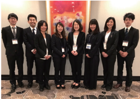
◀ 歯科医師と歯科衛生士が参加して来ました！