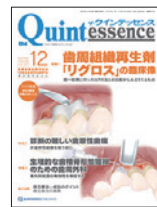
掲載させて頂く 予定の雑誌 【クインテッセンス】

少しでも歯周病治療ができる医院が増えてもらいたいとの思いで書かせていただきました。