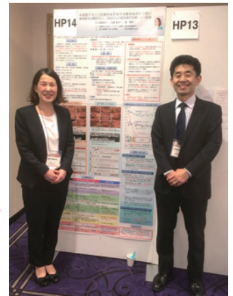
◀ たくさんの方がポスター発表 見に来て下さいました！

全身疾患をもつ患者様の 歯周病治療について まとめたものを発表しました。 学会会場でポスターを見て 下さった方々からアドバイスを 頂き、とても多くのことが学べ、 益々歯科衛生士の仕事が 好きになりました。