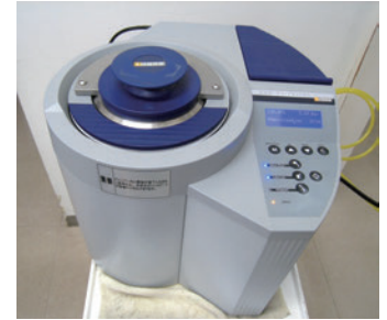
▲ 歯を削る器具専用の滅菌器