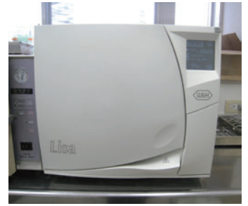
▲ 最高基準「クラスB」の高圧蒸気滅菌器

私たち歯科助手が器具の管理を日々徹底していく事で、来院して下さいる皆様に安心して治療を受けて頂けるよう、これからも一生懸命サポートしていきます。