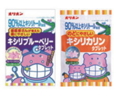
歯みがき屋さん キシリトールタブレット