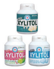
キシリトールガム (ボトル)