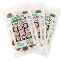
歯医者さんが作った チョコレート