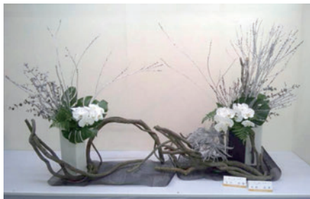
2012年に行われた 華展の写真です